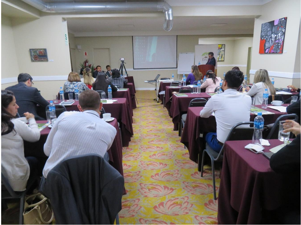
Desarrollo del primer día del evento