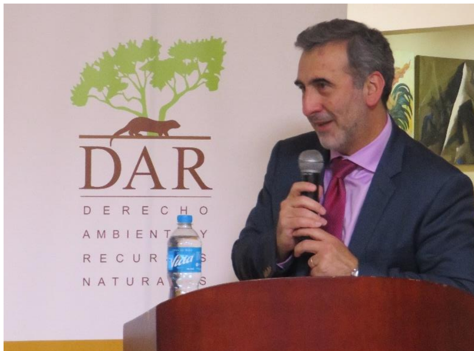
Exposición del Relator Especial de Libertad de Expresión de la CIDH