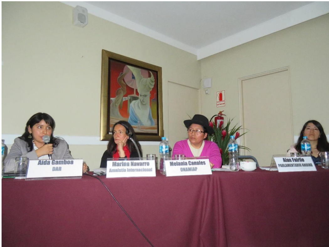
Panel de Autoridades: Obligaciones Estatales en el marco del Acuerdo Internacional en materia de derechos a la información, la participación y la justicia en asuntos ambientales – Acuerdo de Escazú.