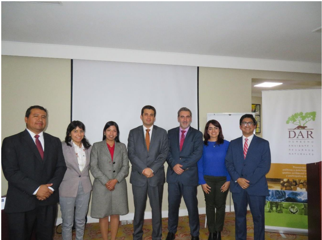
Foto de cierre del primer día