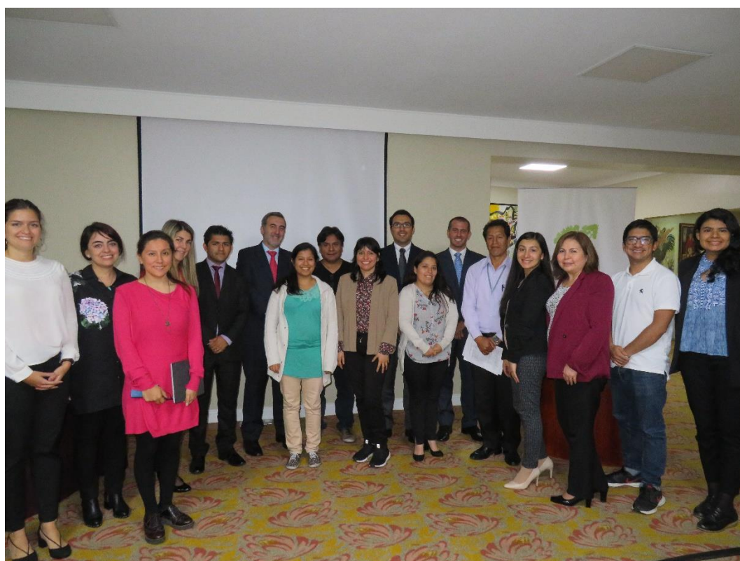
Foto de cierre del segundo día del taller