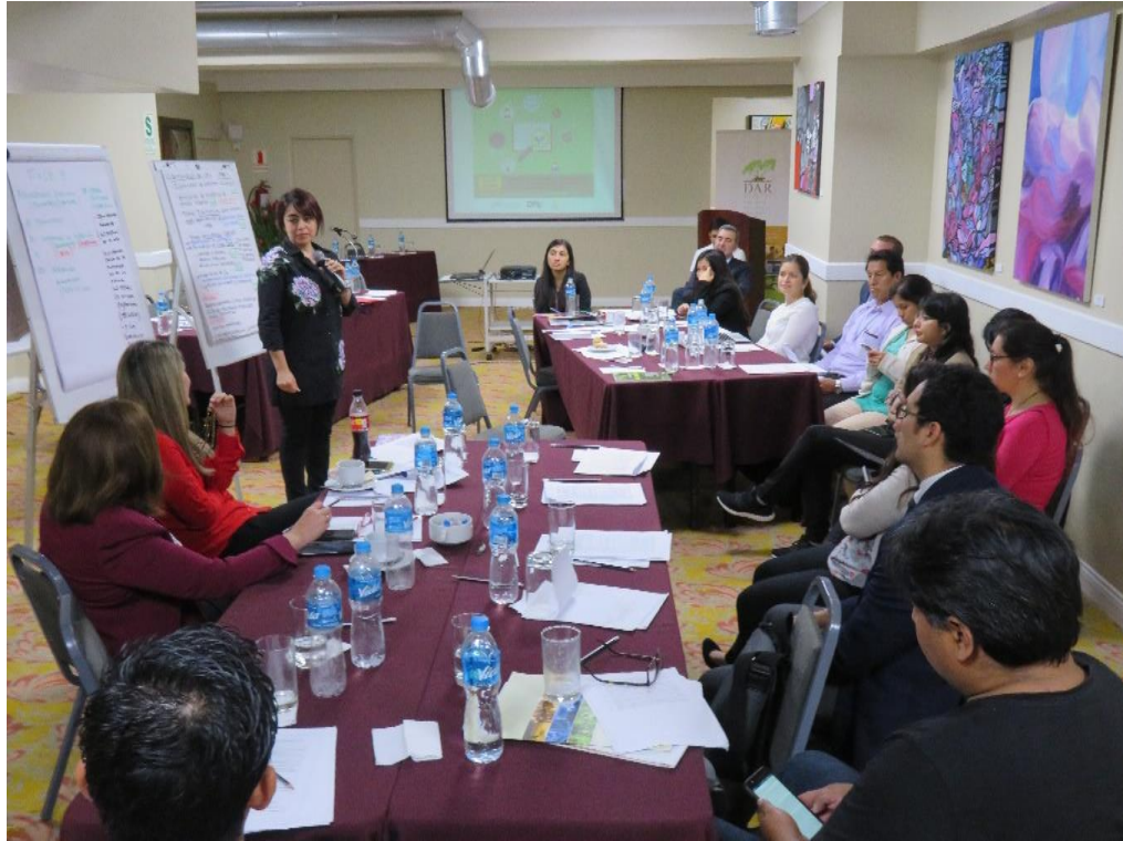
Trabajo de grupos en el segundo día del taller