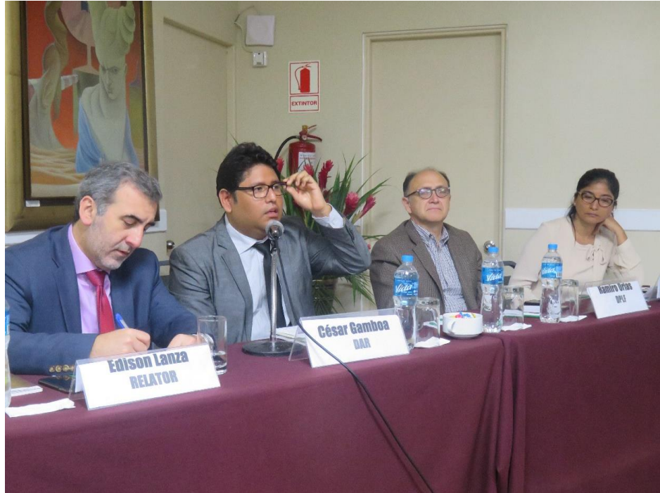
Mesa inicial del Primer Día del evento

Taller Nacional "Estándares interamericanos y legislación nacional en materia de acceso a la información ambiental en contextos de industrias extractivas" 11 y 12 de octubre de 2018