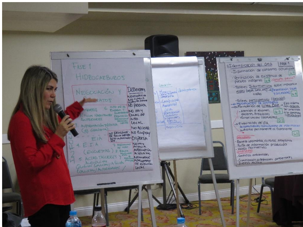
Exposición de los trabajos de grupo