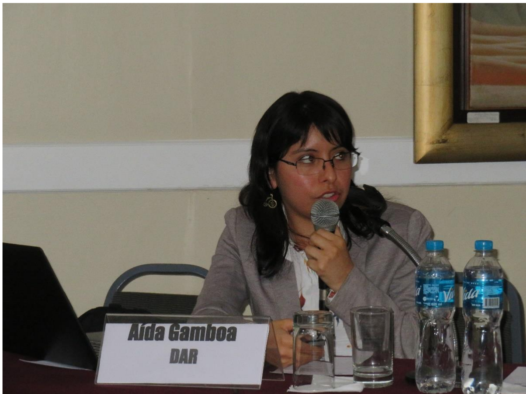
Exposición de Aída Gamboa (DAR). Contexto del Acceso a la Información ambiental en Perú