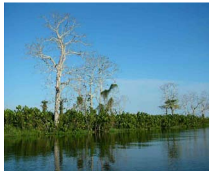
Bosque en Loreto

El Grupo REDD acaba de cumplir dos años en nuestro país y según el Gerente Técnico de los Bosques Amazónicos, en estos dos años el grupo REDD ha jugado dos roles importantes: el primero, el de desarrollar capacidades entre sus integrantes, a través de una serie de eventos de capacitación y Reduccion de Emisiones por Deforestación y Degradación (REDD) y el segundo, consensos Hídricos del Ministerio de Ambiente (MINAM), Elviramente de consulta por parte de las Gómez coincidieron en estas instituciones públicas y multilaterales... Artículo completo págs. 4 y 5 .