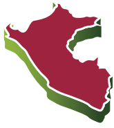
TABLA N° 1.